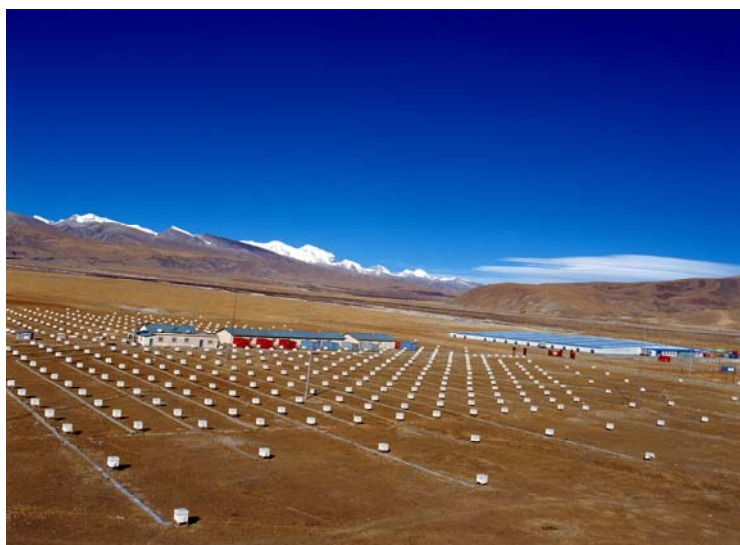
图6 羊八井宇宙线观测站 4300m, 90.53 o E, 30.11 o N

人和是动态的小环境，会随行为者的行为而变化，需要用心经营。正因为我们找到了羊八井，遇上了好时代，育成了奋发的科研团队和有效的国际合作，才成就了今天羊八井的繁荣。要走好前方的路，重点是要经营好这个人 和 。