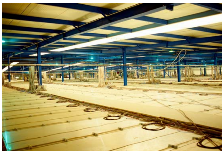
图 5 羊八井观测站的 ARGONIE 地毯式阵列

EAS 结构及膝前区宇宙线能谱等。不过，所有这些都暂时局限于 50TeV 以下能区（也是国际上别的地面阵列所达不到的低能区）。实际上，“地毯”的另一重大优点是对 50TeV 以上的较大的 EAS 才能表现出来的精细测量。这时，“地毯”面对的是由成万个乃至百万个荷电粒子所组成的 EAS 粒子群，从而可能以其个性化的时空分布图像揭露其祖先粒子的重要信息。为此，一个名为“基于 ARGONIE 地毯的羊八井超级复合阵列”（YSCA）的计划已经提出。它将要求为每个 RPC 装备一个大动态的模拟读出，把 RPC “地毯”扩大到整个万平米大厅，在厅内以不破坏地毯连续性的方式均匀分布 5 个 170 平米 RPC \mu 子探测器，在厅外以 264 个大型闪烁探测器环绕大厅布成一个 200 米见方的复合阵列，并以 4 个 432 平米的流光管 \mu 子探测器分列于阵列的四角，形成 YSCA 的基本框架。这将不仅能以更好的性能支持原先计划的所有工作，而且能最好地利用 \gamma -EAS 与 P-EAS 在 \mu 子密度上（1: 60 级）的大差距去寻找超高能 \gamma 源（它不可能是电子源只能是质子源），亦即迄今仍未被任何实验看到的宇宙线产生的源头和故乡。它还可能充分利用“地毯”所呈现的 EAS 粒子盘的详尽图像的个体特征差异，在 \mu 子信息等的协助下，找到逐事例地区分 EAS 祖先粒子的元素成分的有效方法，成为打开“膝区物理”老大难之门的一把钥匙，解开宇宙线研究“成分/模型纠缠”的一柄快刀，发现稀有事例、未知现象的一种利器，并成为功能全面而强大、能覆盖广阔能区、能支持多个课题、能为多种学科长期服务的羊八井当家设备。