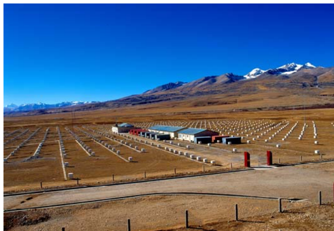
图 4 羊八井观测站 AS \gamma -III 阵列

挖掘高海拔的物理潜力需要有上规模、够水平的实验设备；大规模的高精设备又须有现代技术和专业人员保障其高效运行。看看近 800 个闪烁探测器整齐排列的 AS \gamma 阵列以及 ARGO 实验厅中壮观的 RPC “地毯”，不由人不为它们的气势所感动；再看看它们天涯咫尺的运行功能，又不由人不惊叹这穷山僻壤竟能与时代发展有如此超前的同步。