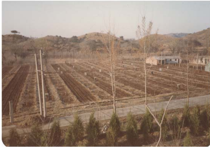
图 2 怀柔 EAS 阵列

怀柔练兵 在张文裕、萧健先生的推荐下，我们得到了第一份自然科学基金，开始了 1983~1988 的全自力更生的怀柔 EAS 阵列建造，即“西藏计划”的技术和人才准备阶段。除关键的集成电路块和两个高压电源而外，所有东西都是从国产材料、元件做起的。在当时的条件下，这对一个从零开始的自由选题项目而言，自然要有许多今天所难以想象的额外付出。然而，它的多方位、全过程的历练，它首次在本国土地上展示的单个 EAS 的结构和超高能宇宙线能谱，的确为西藏计划的推进建立了信心、积累了经验、培训了人员。它也同时让我们认识到，在当时的国内经济、技术、信息条件下，要靠这种方式及时启动西藏计划并挺进国际前沿几乎是不可能的。以高山地利和怀柔队伍为筹码组织国际合作，是解决我们的资金、设备、信息问题和保持国际联系的有效途径。